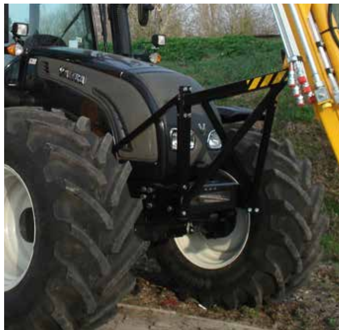
Werktuigdrager aan voorzijde van het aanbouwframe. Hier rust de giek op in transportpositie.