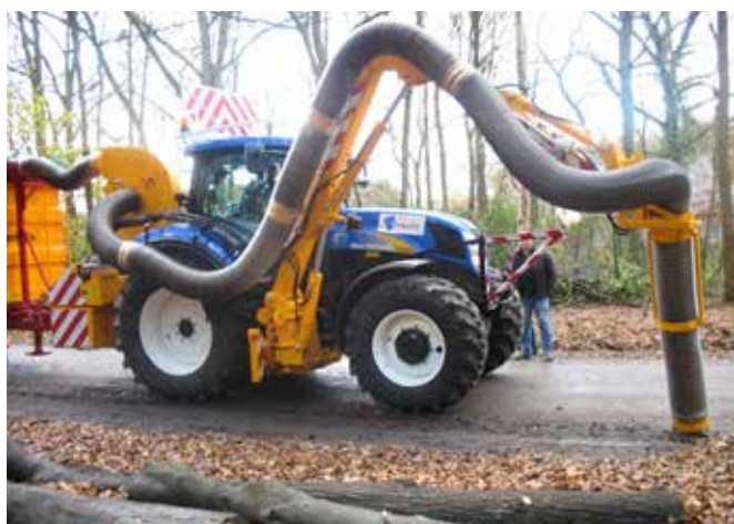
Grenadier met afzuiging en bladzuiger.