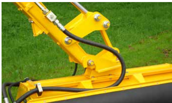
De bakcilinder kan naar wens worden uitgevoerd met een tuimelstuk, die de kiephoek vergroot.