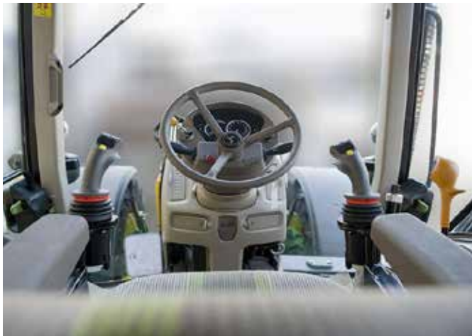
Elektrische joystickbediening is als optie verkrijgbaar. Ook is het mogelijk om te kiezen voor een extra bediening van de zweefstand naast de rechter joystick, zodat het bedieningspaneel achterin de cabine geplaatst kan worden.