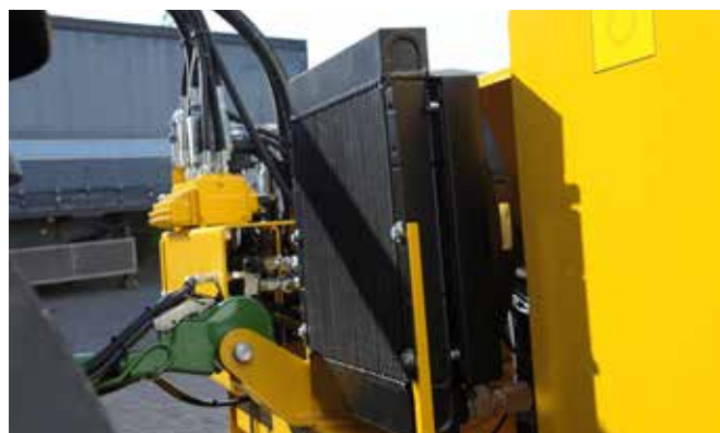
De Grenadier is standaard uitgevoerd met een oliekoeler van 13,2 kW om temperatuurpieken en –schommelingen te voorkomen.