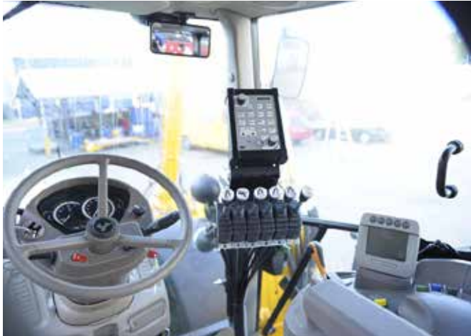
In iedere tractor kiest Herder altijd voor de meest ergonomische plek voor de machinist.

Werken met de Grenadier is een plezier. De bediening is eenvoudig en bedieningsorganen zijn logisch geplaatst. Met de optionele joystickbediening maakt u uw werkplezier helemaal compleet.