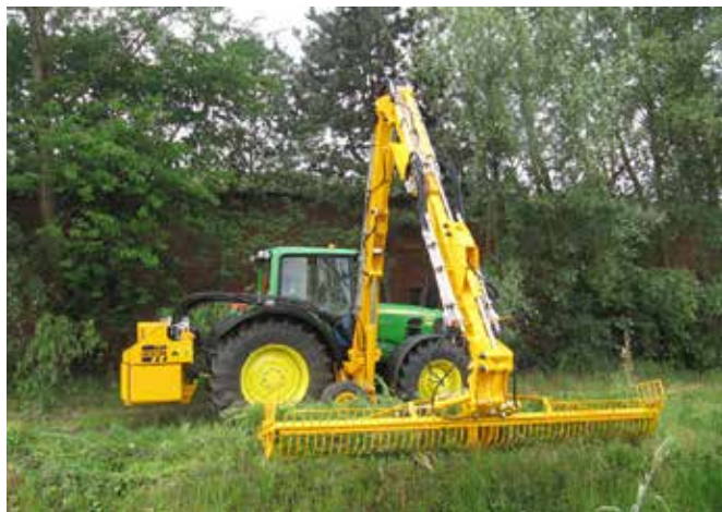
Grenadier met maaikorf.