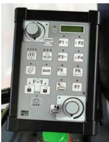
De bedieningskast is compact en logisch ingedeeld.

Met elektrische joystickbediening heeft u de keuze tussen 4 bedieningsmenu's, waarbij EURO-bediening standaard als menu 1 geprogrammeerd staat. Hiernaast kunt u twee andere menu's programmeren voor het (rijdend) werken met de rechter joystick. Het vierde menu kunt u volledig instellen naar wens. Op de bedieningskast kan men de voorasblokkering inschakelen. Afhankelijk van de gekozen opties op de Grenadier kunt u deze ook regelen, inschakelen of bedienen vanaf de bedieningskast.