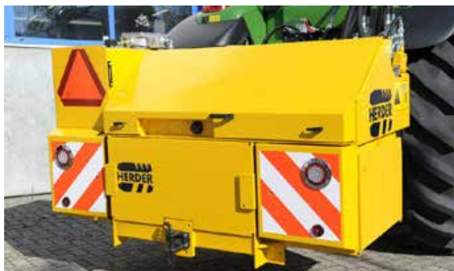
Hydrauliekunit met veiligheidsmarkering en LED verlichting, gedragen in de 3-punt van de tractor.