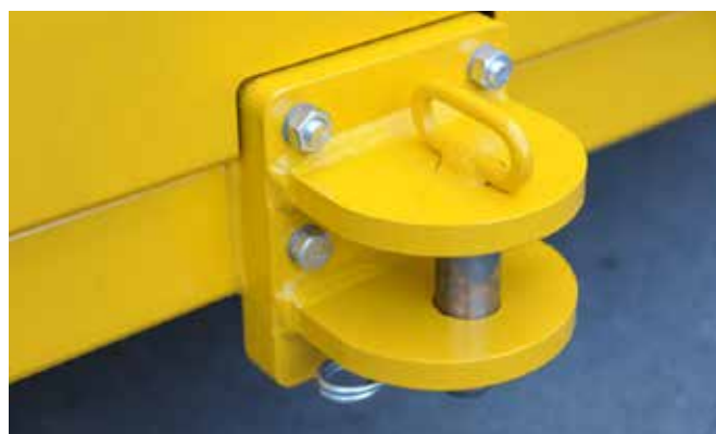
Zware trekhaak voor de bevestiging van een opvangwagen.