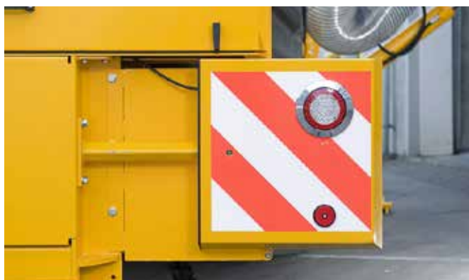
De markeringsborden met LED verlichting zijn uitschuifbaar om bij overschrijding van de breedte norm te kunnen voldoen aan de wegenverkeerswet.