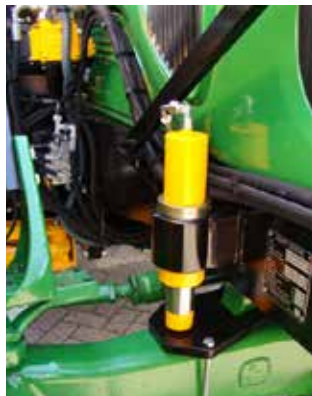
Voorasstabilisatie is geen overbodige luxe. Links voor een vaste vooras en rechts voor een geveerde vooras.

De Grenadier wordt standaard geleverd met een aantal zaken die ervoor zorgen dat u probleemloos kunt werken. Extra's waar u dus niets voor hoeft te betalen.