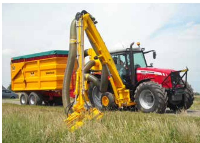
Grenadier met afzuigventilator en ecomaaier (KMU).