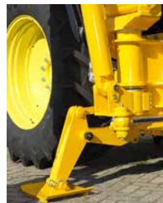
Draaikolom voor bevestiging van de giek. Hier de standaarduitvoering met een steunpoot voor extra stabilisatie.