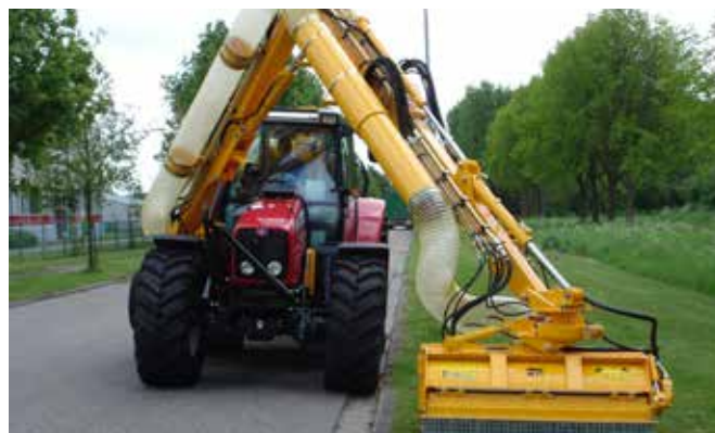
Grenadier MBK513 is uitgevoerd met een draaikolom met 15° extra draaibereik naar links, een schuifgiek en een schuifbuis als alternatief voor de afzuigslang.