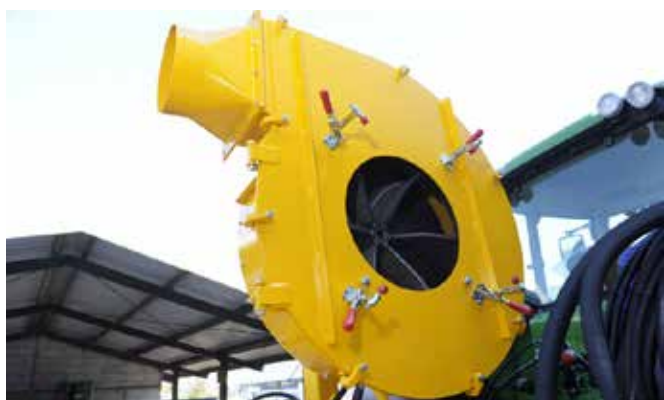
Snelsluiting van de slang op het waaierhuis, waaier met achterover gebogen schoepen.