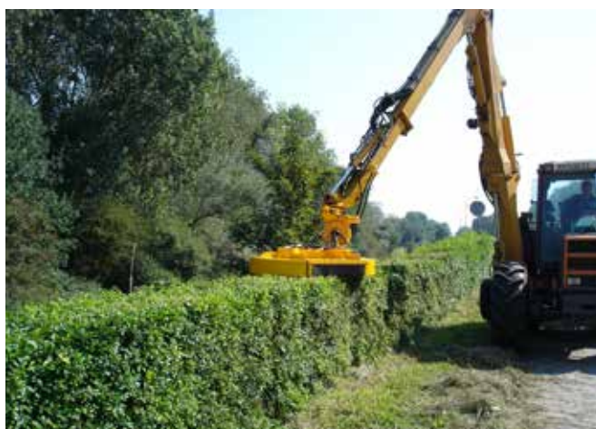
Grenadier met heggenslagmaaier.