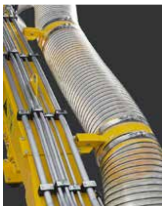
Bevestiging van de afzuigslang op de giek.

De slang is verkrijgbaar in \varnothing 300 mm.