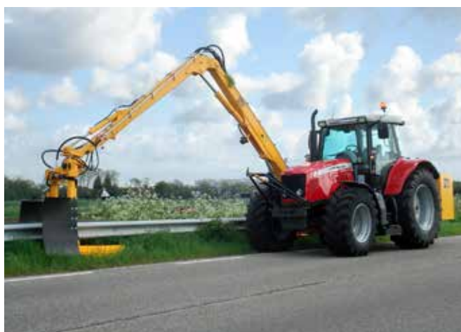
Grenadier met vangrailmaaier.