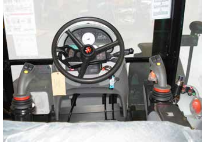
De joystick zorgt voor nauwkeurige bediening van de gieken.