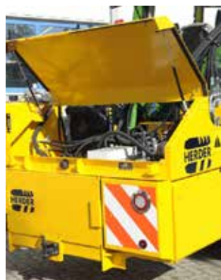
Achterklep met gasveren voor goede toegankelijkheid tot de hydraulische componenten.